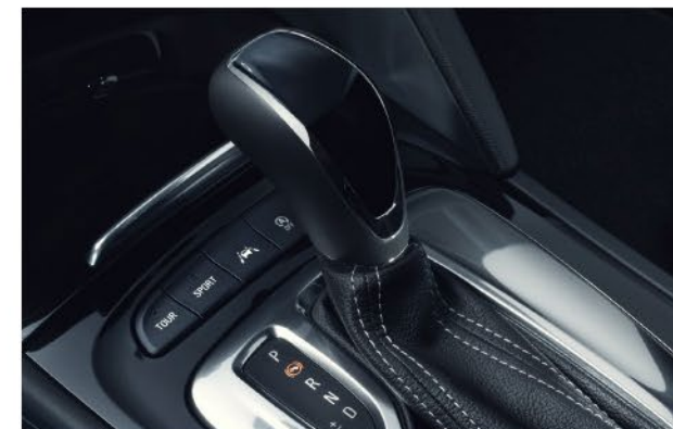
Automatski mjenjač na modelu GSi i Exclusive