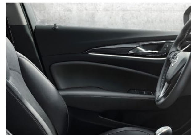
Prošiveni umetci na prednjim i stražnjim vratima